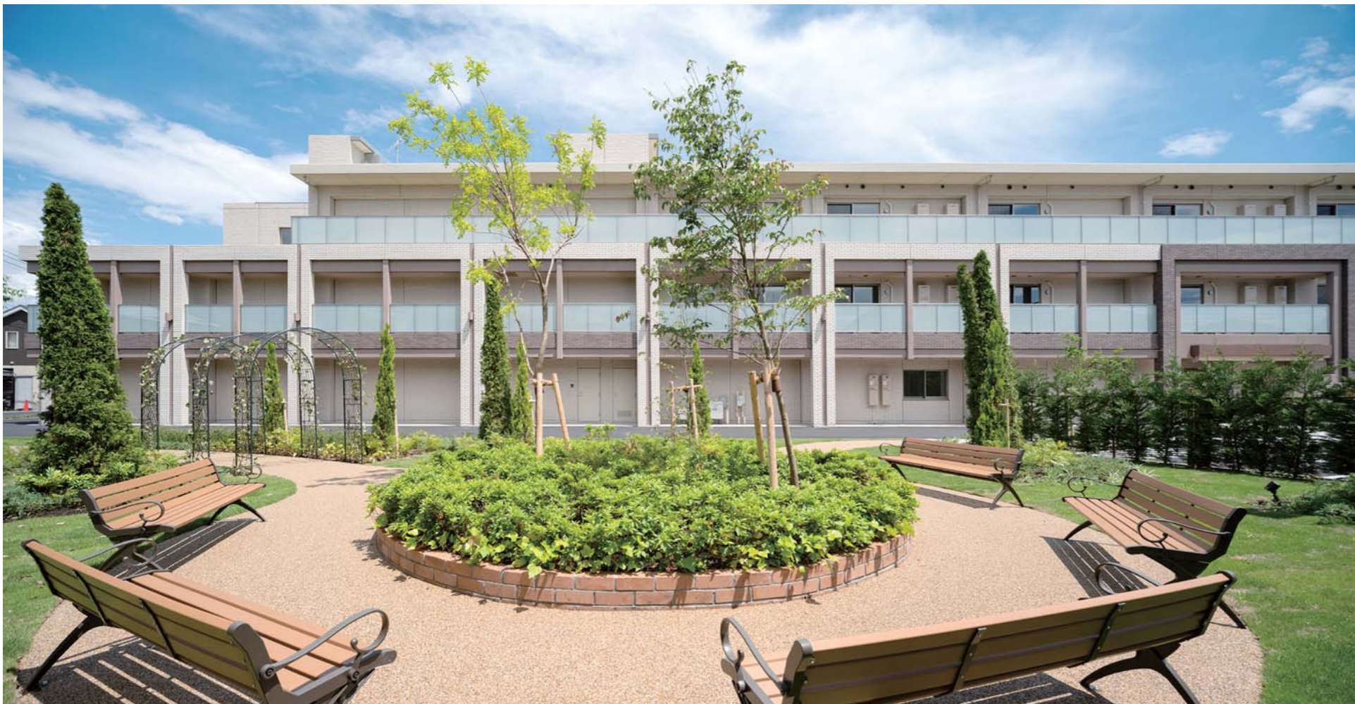
設計・監理/井上穰建築デザイン研究所 施工/鉄建建設