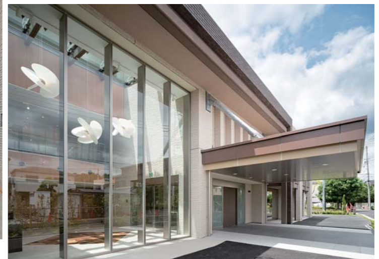
メインアプローチ